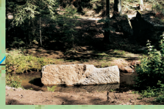
Pont du Brocard